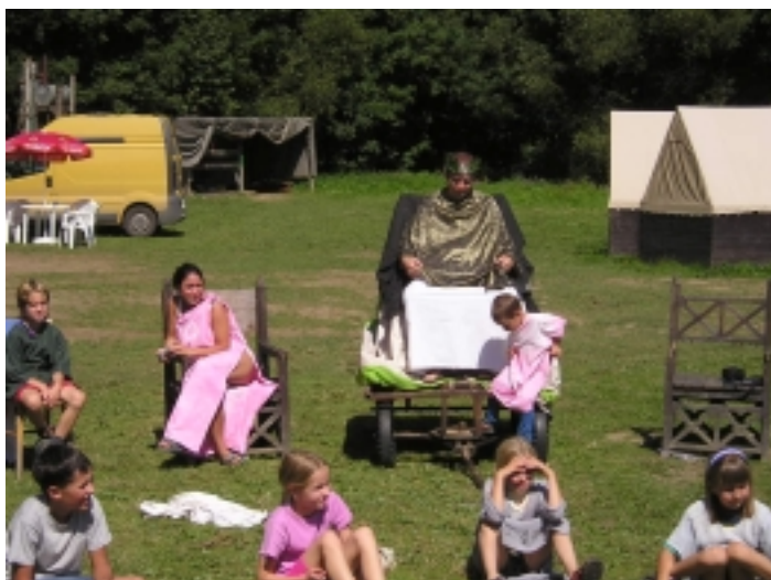
Král na trůně v průběhu turnaje

Tak vznikly 4 družiny „ argonautů “ a po rozlosování, kdo půjde kterou cestou, vyrazily po mapě směrem ke Kolchidě ( její umístění bylo zcela smyšlené, potřebovali jsme se vejít do mapy Řecka a Malé Asie ).