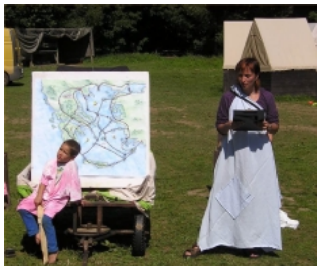
Bohyně duhy Íris a mapa cesty k Rounu

Jako každoročně byl pro jednotlivce připraven systém zkoušek, jejichž plněním bylo možno dosáhnout lepší pozice pro sebe a ohodnocení pro svůj tým. V rámci družin byla letos pevně stanovená potřebná povolání a zkoušky, které každému povolání příslušely. Zkoušky navíc nad rámec svého povolání pak přinášely družině další zisk navíc. V průběhu tábora jsme místo zkoušky „Hvězdy“ byli nuceni dát „Tangram“, neboť počasí a měsíční úplňk nám nedovolily naučit a vyzkoušet děti ze znalosti hvězd a souhvězdí.