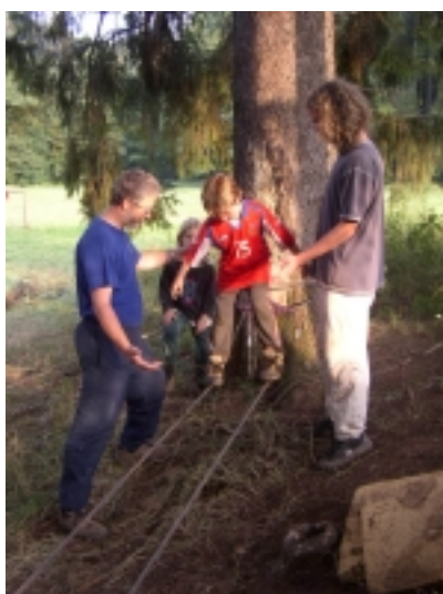
Zkouška „Lanové překážky“

Při splnění všech zkoušek stanovených pro jednotlivá povolání byl každému udělen jmenovací gletj.